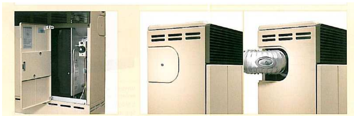
Pohodlné ovládání zepředu